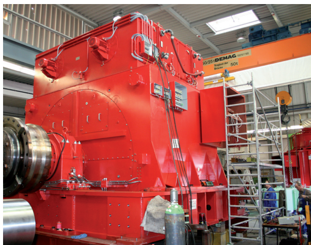
CE-Risikoanalyse am Produkt (Motor der Lloyd Dynamowerke, Bremen)